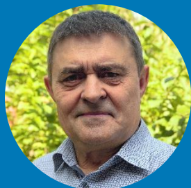
Игорь Ананьев Президент